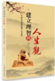
建立理智的人生观