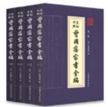
曾国藩家书全编（全四册）